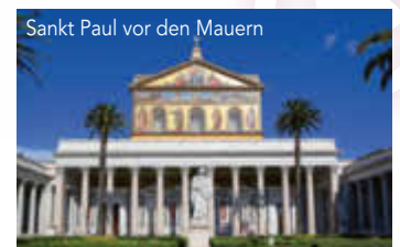
Sankt Paul vor den Mauern